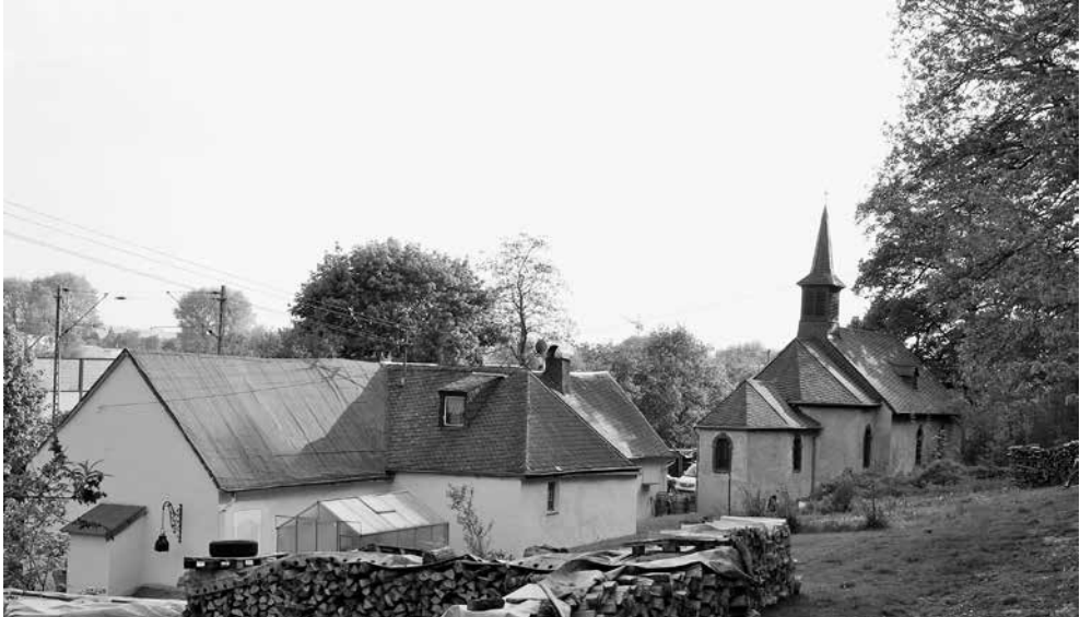
Abb. 2: Das ehemalige Trierer Leprosorium St. Jost. Im Vordergrund die Wohn- und Wirtschaftsgebäude, im Hintergrund die Kapelle mit doppelt gestaffelter Apsis und Dachreiter, in: UHRMACHER, Lepra (wie Anm. 1), S. 338.

schon im 13. Jahrhundert erbaut – der heutige Bau stammt von 1706 19 – scheint gut nachvollziehbar (Abb. 2). Jodocus war ein ungemein beliebter Heiliger, der im Raum zwischen Skandinavien und der Schweiz, der Bretagne und Kärnten/Krain verehrt wurde, mit Schwerpunkten in der Picardie und den Südlichen Niederlanden. 20 Nach Heiligenviten des 10. und 12. Jahrhunderts verzichtete der um 699 verstorbene Fürstenson aus der Bretagne auf die Macht und lebte als Pilger, Priester und Einsiedler. Er wurde geschätzt als Patron der Pilger, Schiffsleute, Blinden und Bäcker, aber auch der Leprosen; man suchte bei ihm Schutz für das Vieh und die Ernten, gegen Feuer, Fieber und Pest. In Luxemburg gibt es einen St. Jost-Turm und eine St. Jost-Straße, Schwerpunkt der jährlichen St. Jost-Prozession. Das Kloster Saint-Josse sur Mer in der Picardie, ursprünglich Standort von Jodocus' Klause Runiac, wurde im Hochmittelalter zu einem der bedeutendsten Pilgerziele Mittel- und Westeuropas. 21